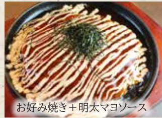
お好み焼き+明太マヨソース

王道のお好み焼き ミックス (豚・えび・いか) 会員価格 税込 1,190円 定価 税込 1,500円