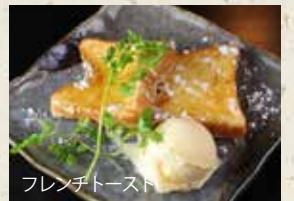
フレンチトースト

フレンチトースト【バニラアイス添え】 会員価格 税込 430円 定価 税込 530円