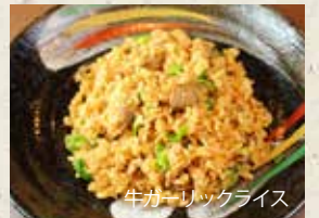
牛ガーリックライス