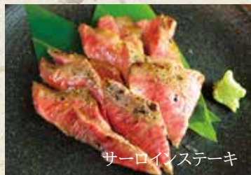
サーロインステーキ