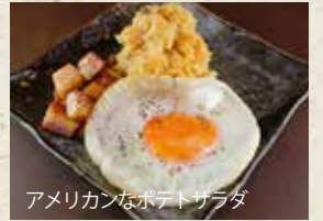
アメリカンなポテトサラダ

丸ごと冷やしトマト ~塩こぶのせ~ 会員価格 税込 490円 定価 税込 600円