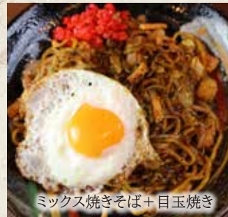
ミックス焼きそば+目玉焼き