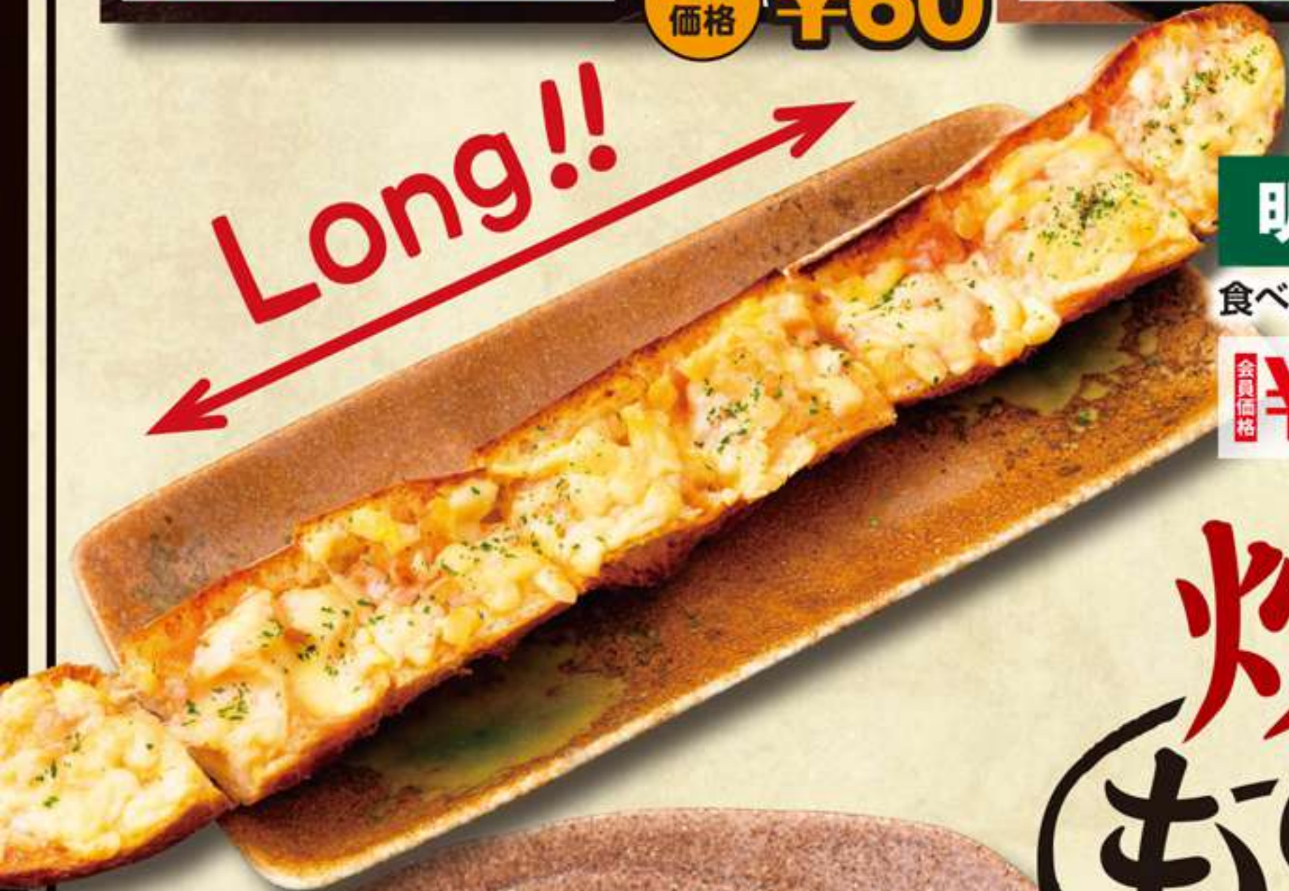
明太マヨロングピザ