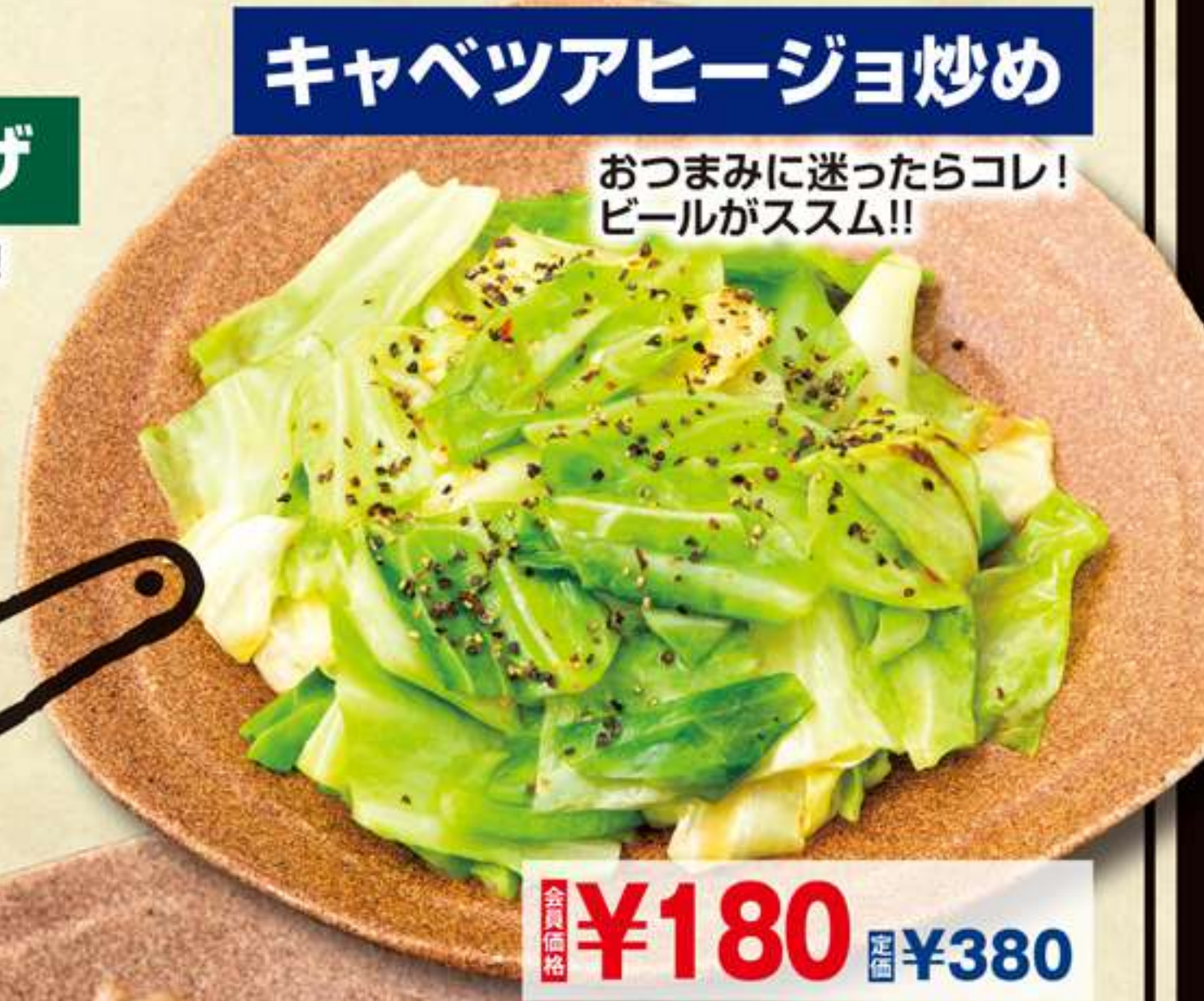
キャベツアヒージョ炒め