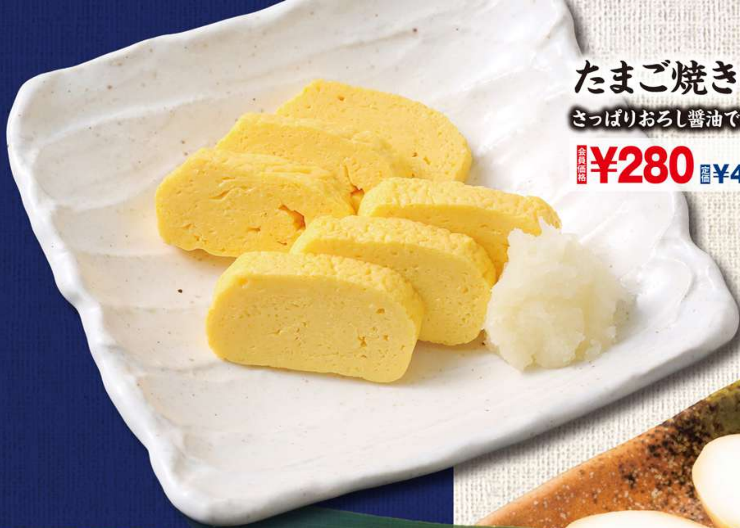
たまご焼き さっぱりおろし醤油で召し上がれ