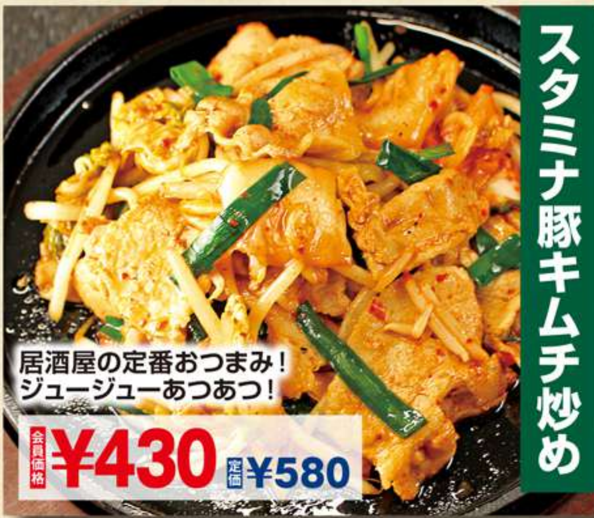
スタミナ豚キムチ炒め