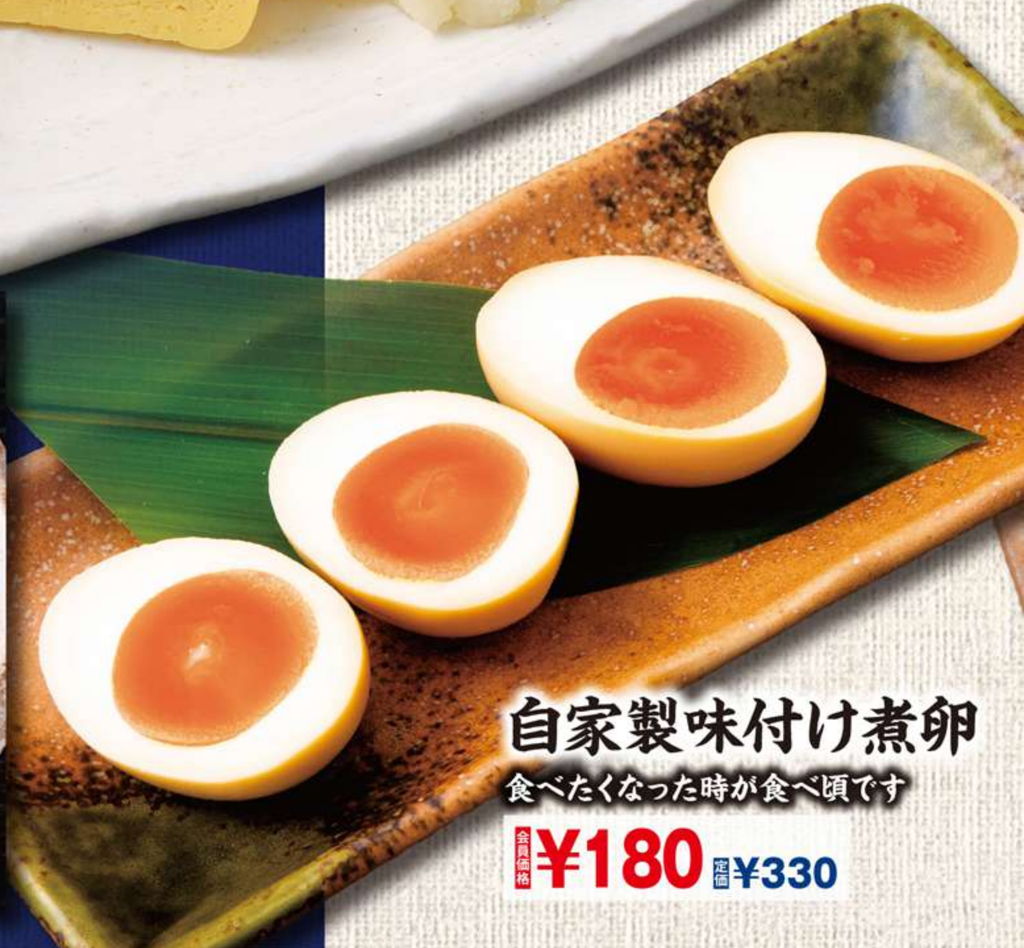
自家製味付け煮卵