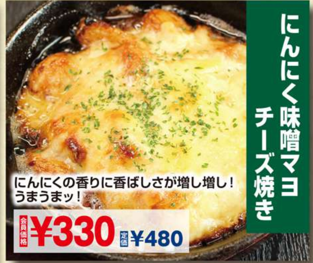
にんにく味噌マヨ チーズ焼き