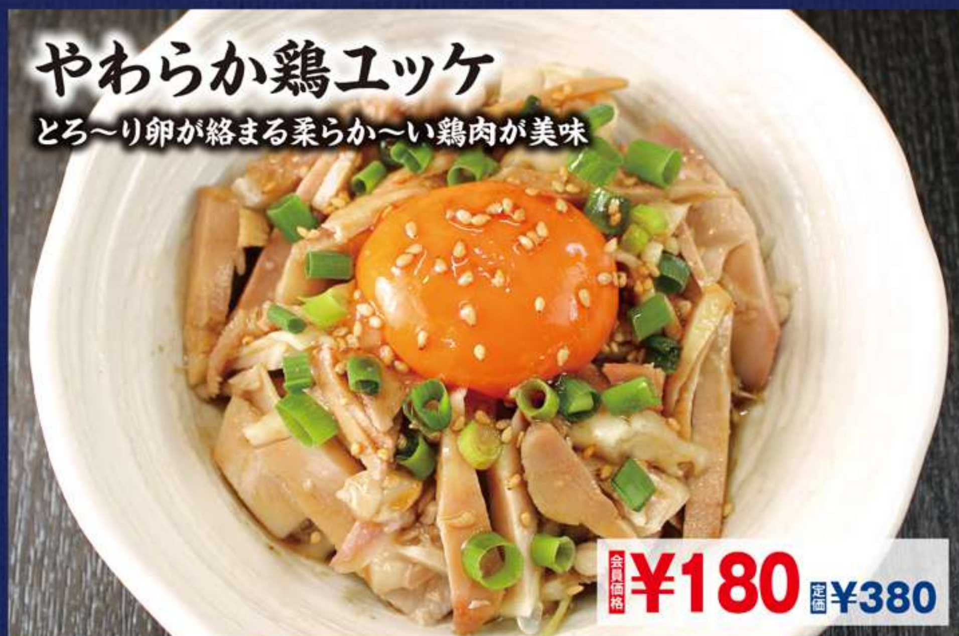
やわらか鶏エツケ