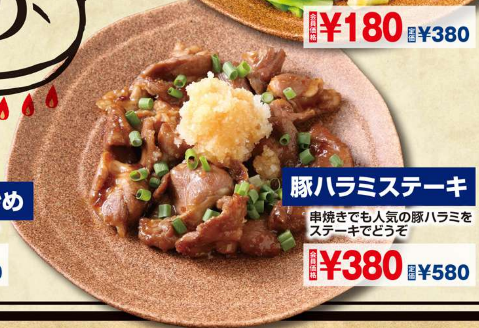
豚ハラミステーキ