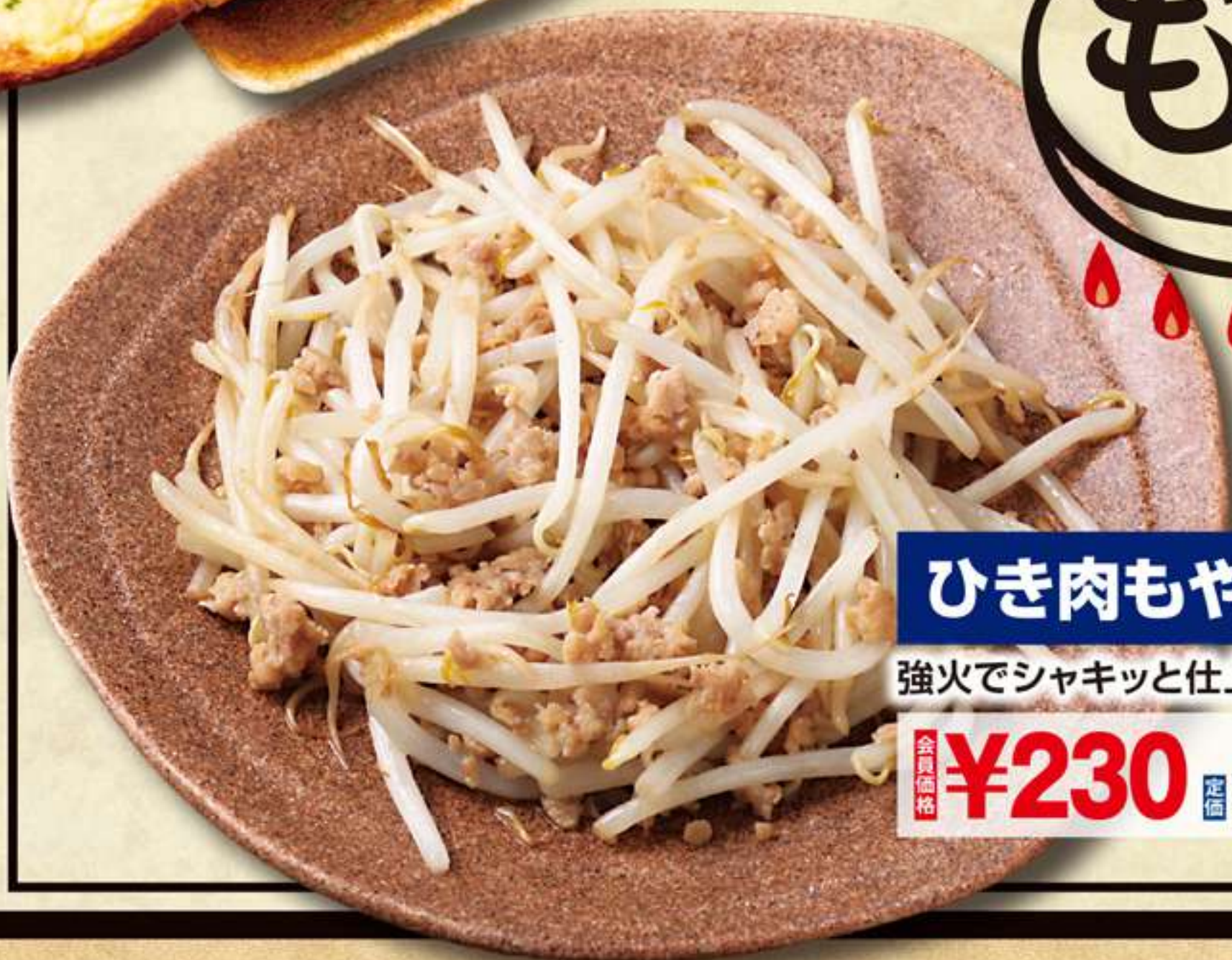
ひき肉もやし炒め