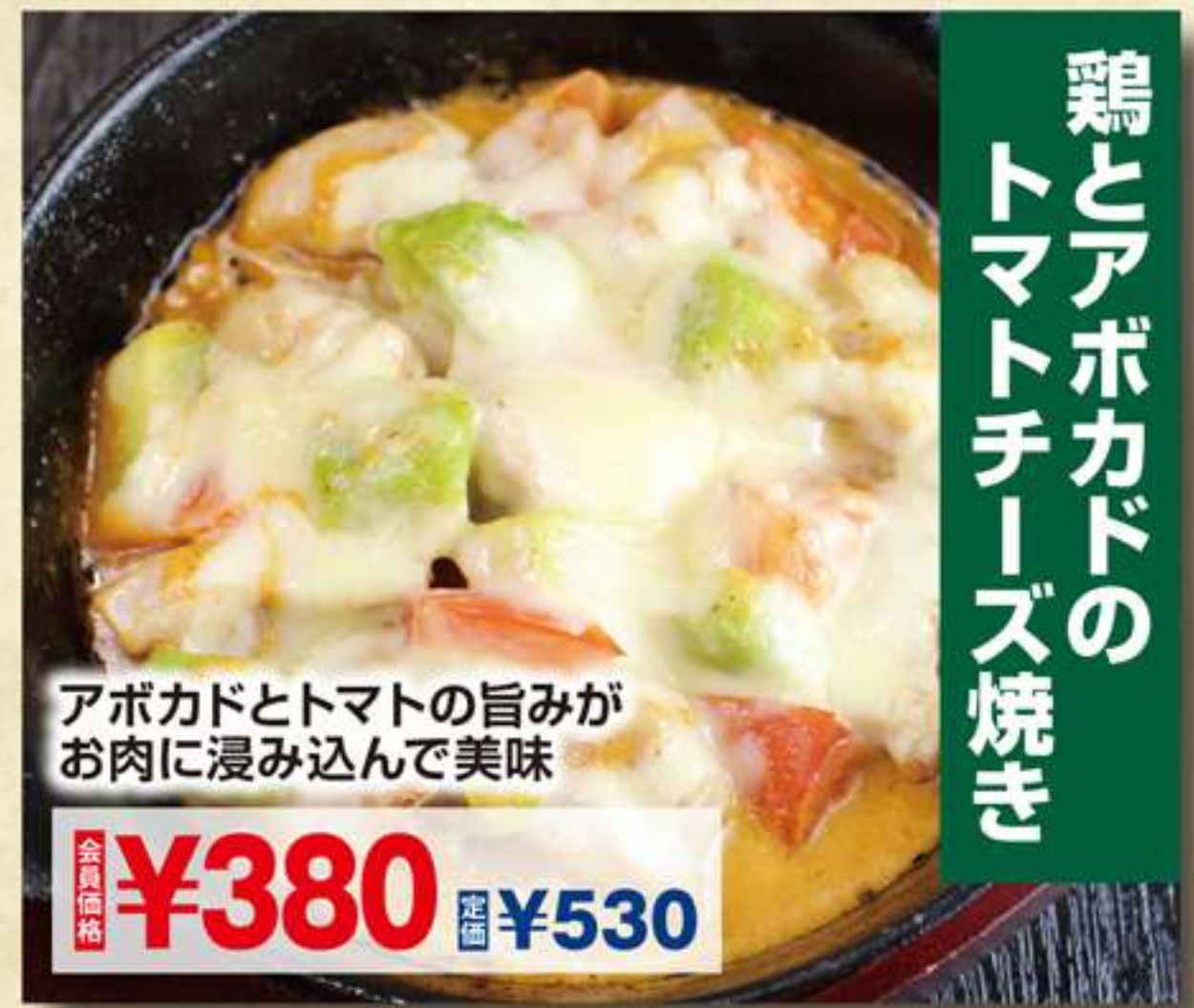
鶏とアボカドの トマトチーズ焼き