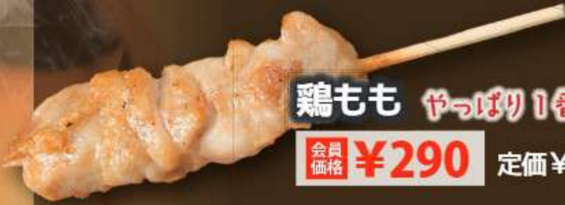
鶏もも やっぱり1番人気!