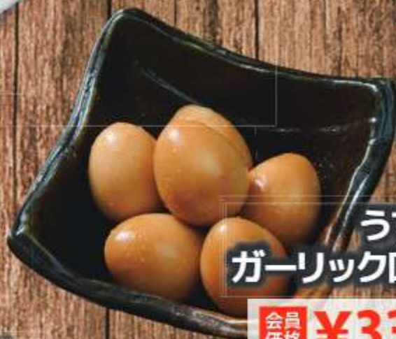
うずら ガーリック味玉