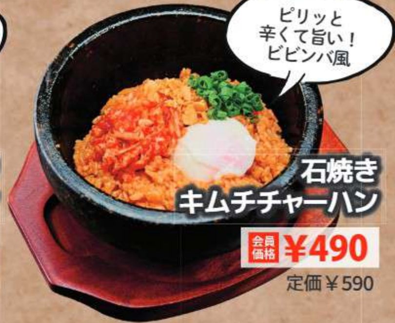
石焼き キムチチャーハン