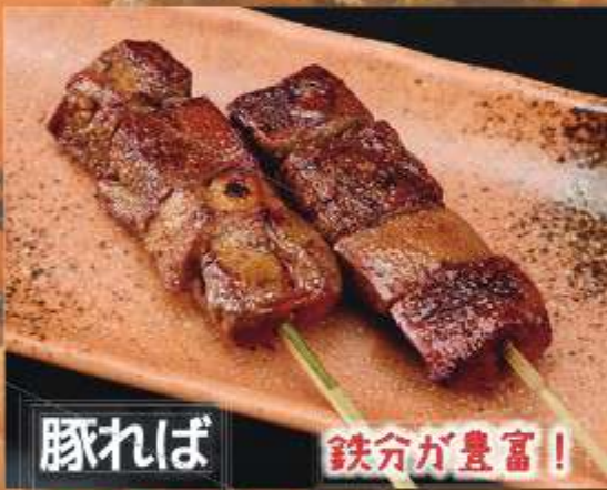
豚れば 鉄分が豊富!