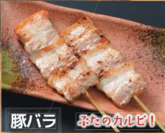
豚バラ ふたのカルビ!