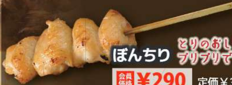
ぼんちり とりのおしりのお肉 プリプリです