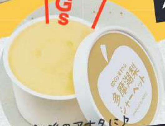
さっぱり派のアタに♪ 多摩湖梨シャーベット ¥330