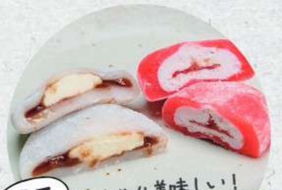
ひんやり美味しい! 紅白まんじゅうアイス ¥230