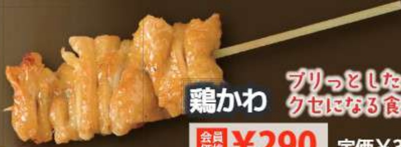
鶏かわ プリっとしたクセになる食感