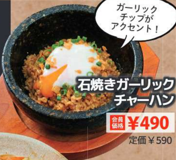
石焼きガーリック チャーハン