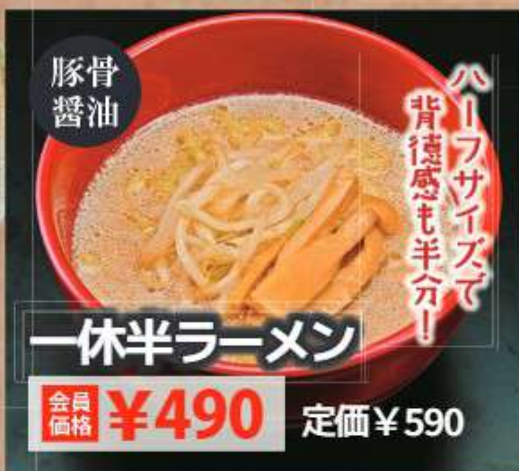
ハーフサイズで 背徳感も半分!