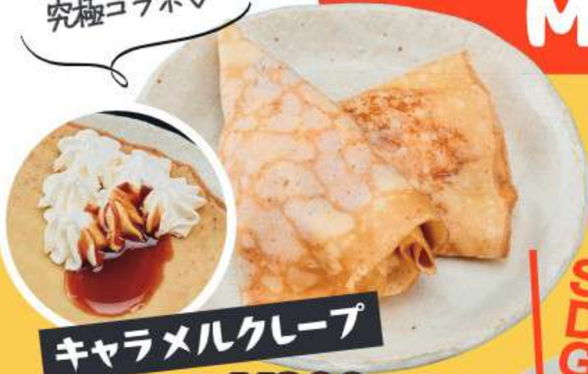
キャラメルクレープ ¥290