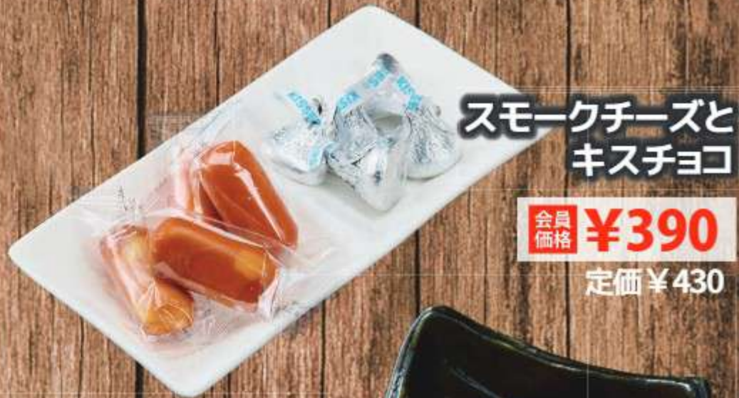
スモークチーズと キスチョコ