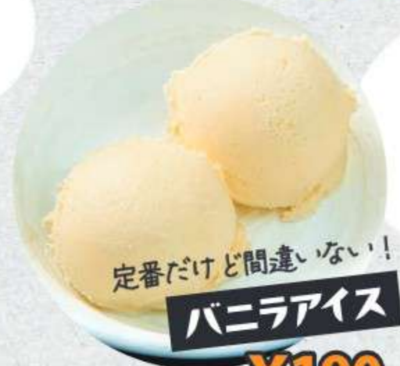
定番だけど間違いない! バニラアイス ¥190