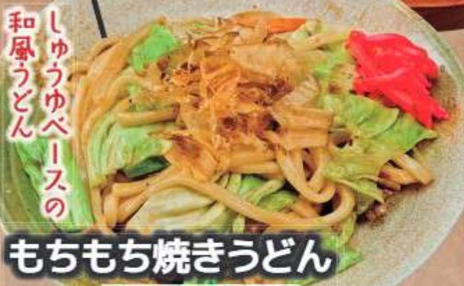
しゅうゆべーの 和風うどん もちもち焼きうどん