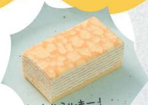
ぎっしりミルクー! ミルクレープ ¥330