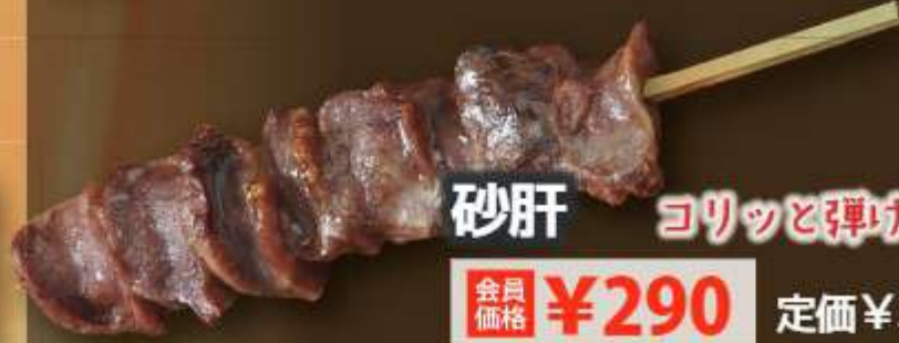
砂肝 コリッと弾ける旨み!