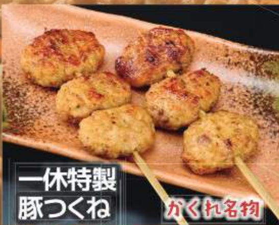
一休特製 豚つくね がくれ名物