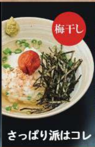
さっぱり派はコレ