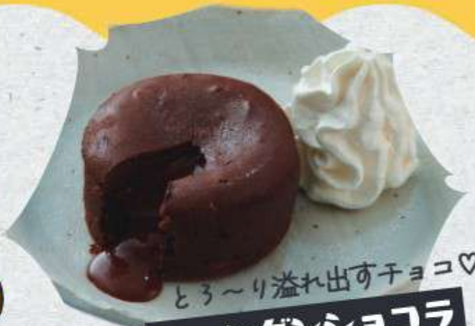
とろ〜り溢れ出すチョコ♡ フォンダンショコラ ¥390