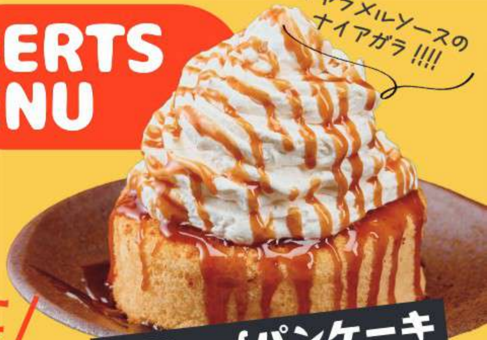
タワーofパンケーキ ¥490