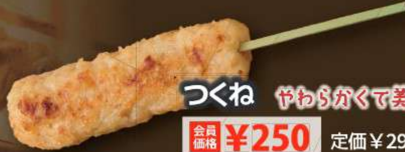
つくね やわらかくて美味しい!