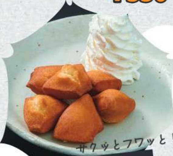
サクッとフワッと! 揚げたて コロコロドーナツ ¥290